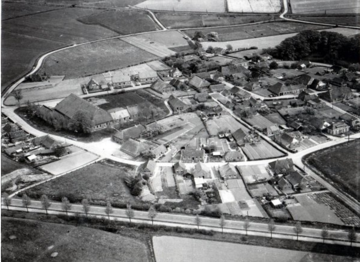
Uiterst linksboven: Het Wierhuis, waar wierbaas Jimke Bijlstra woonde.