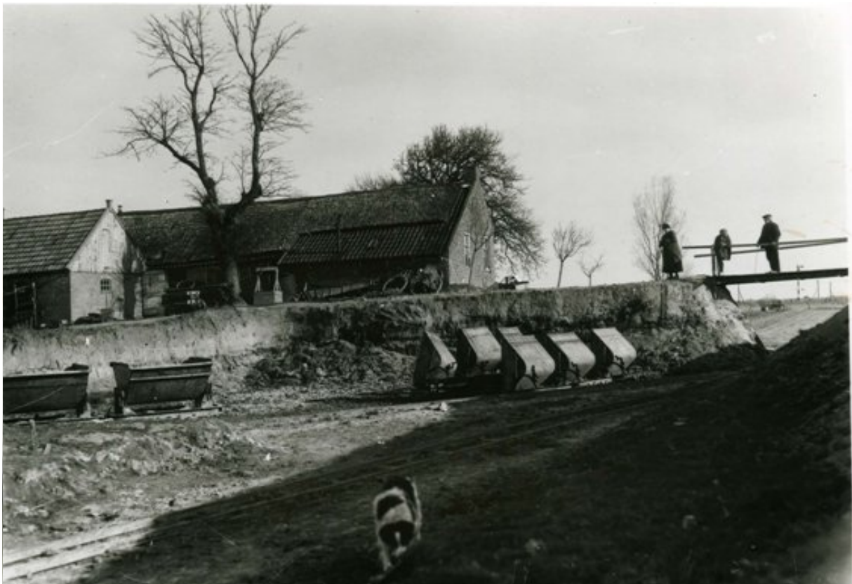
Boerderij 't Olhof, op de wierde De Boterbloem, kan alleen nog per brug Rasquert bereiken.

Een commerciële afgraving richtte zich op de onbewoonde delen van een terp, maar soms was het profijtelijk een huis af te breken. De terp moest aan vaarwater liggen vanwege het noodzakelijke transport per schip. Een opvaart in de terp verkleinde de afstand waarover de terpaarde naar het schip moest worden gekruid. Vanaf 1870 werden kruiwagens opgevolgd door kipkarren die door paarden over rails werden getrokken. Een opvaart in de terp was toen niet meer nodig.