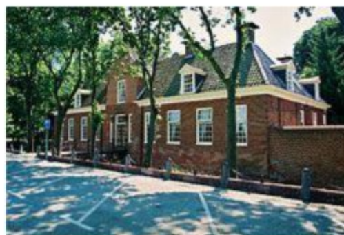
Welgelegen, nu Rijksmonument.

(Kleinemeer ligt ten zuiden van Sappemeer en evenals die plaats dankt het zijn naam aan een meer dat hier vroeger lag, maar dat in de tijd van de verving is verdwenen. De plaats heeft drie veenborgen gekend, alleen "Welgelegen" is nog over).