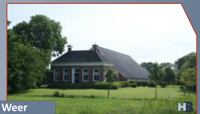
Boerderij Ter Weer