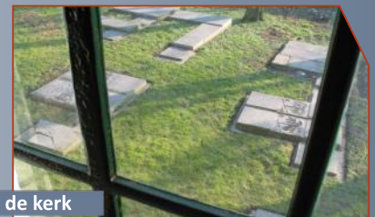
Kerkhof rond de kerk