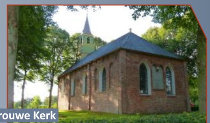
Onze Lieve Vrouwe Kerk